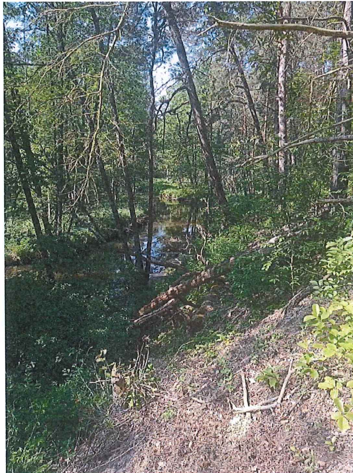
Fot. 3 Strome zbocze terenu zagrożonego na zakolu rzeki.