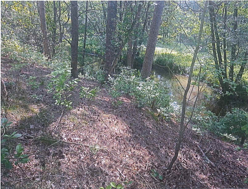
Fot. 2 Widok na teren zagrożony – zbocze podcinane przez rzekę Myślę.