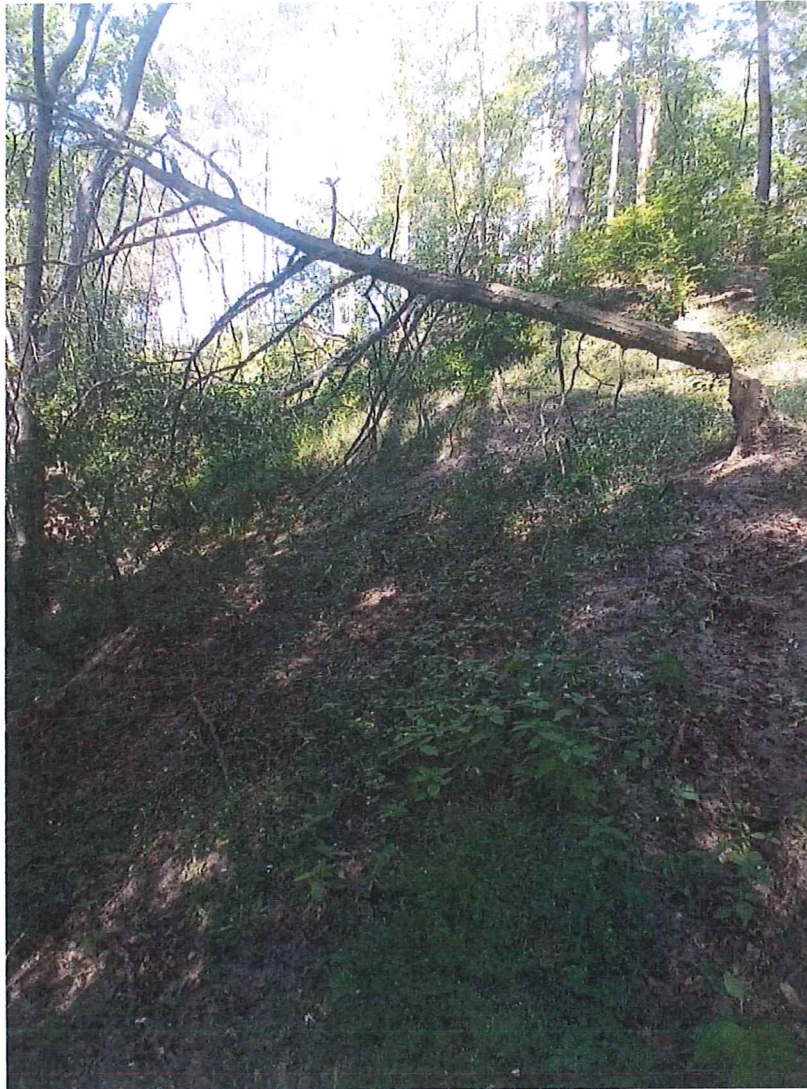
Fot. 4 Widok na teren zagrożony.