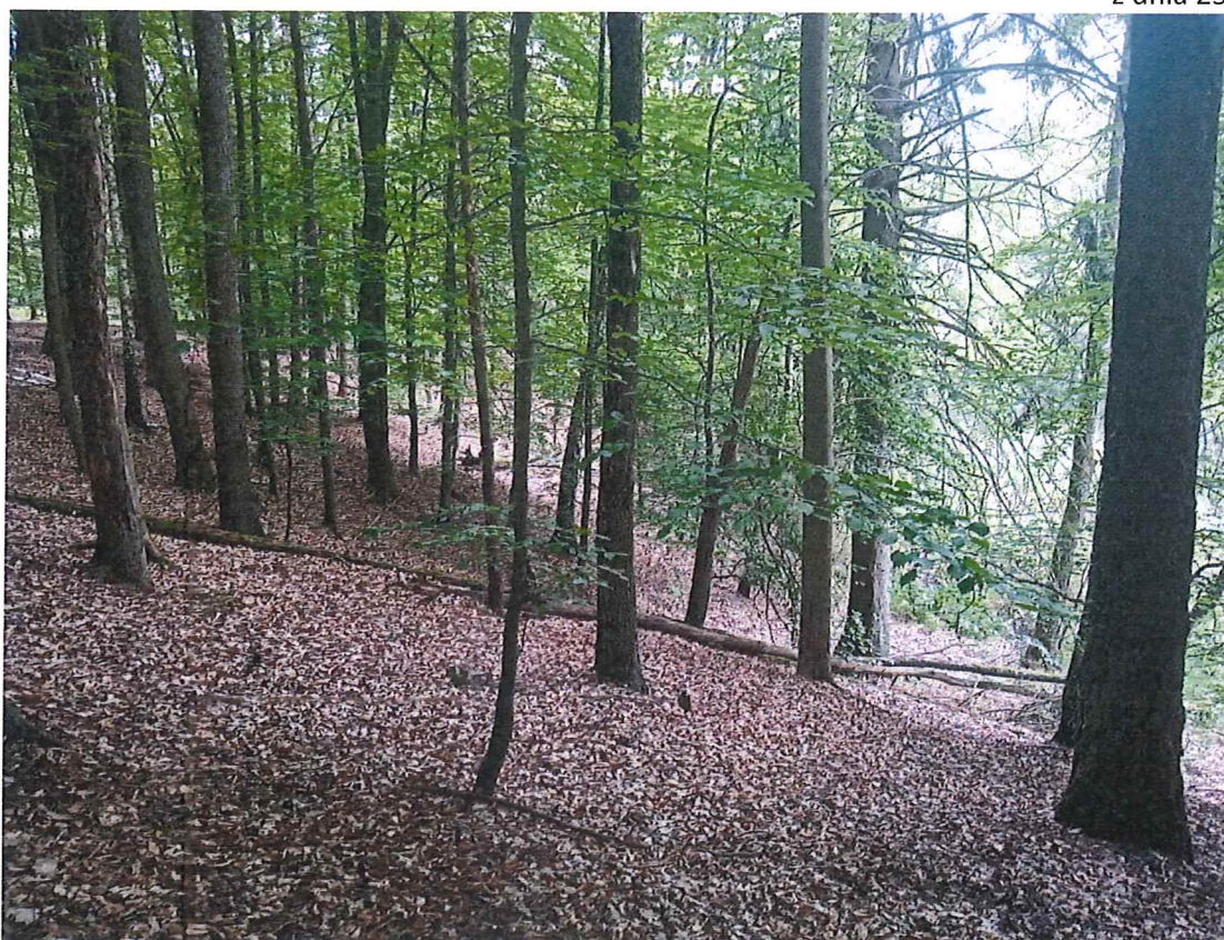
Fot. 2 Widok ogólny na teren zagrożony ruchami masowymi ziemi; przejawy spęływania na zboczu.