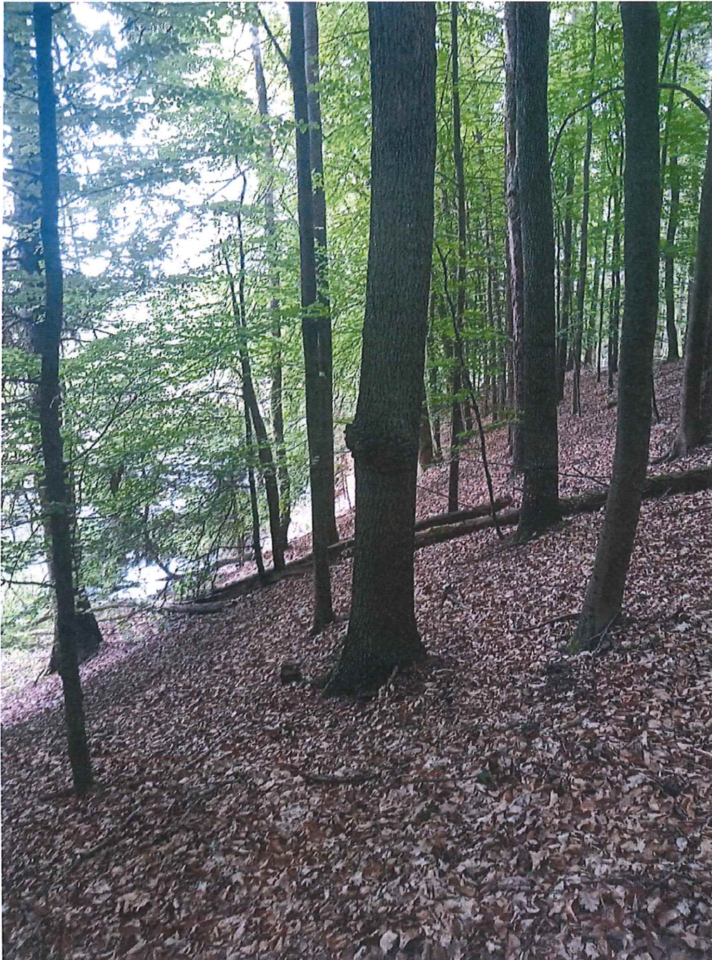
Fot. 4 Widok ogólny na teren zagrożony ruchami masowymi ziemi; zbocze podcinane przez rzekę Kosę (lewa strona zdjęcia).