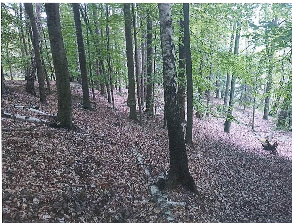
Fot. 3 Widok ogólny na teren zagrożony ruchami masowymi ziemi.