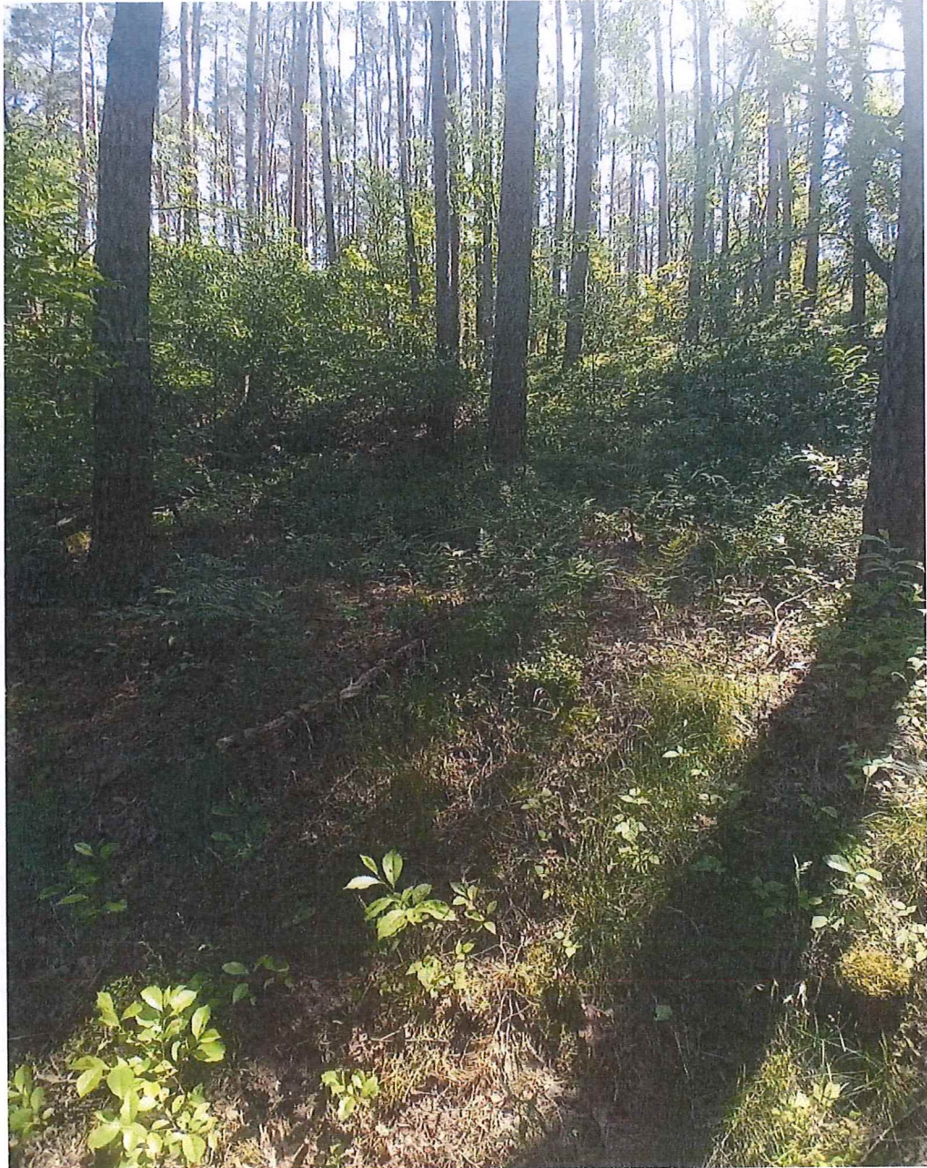
Fot. 3 Widok na część terenu zagrożonego ruchami masowymi ziemi.