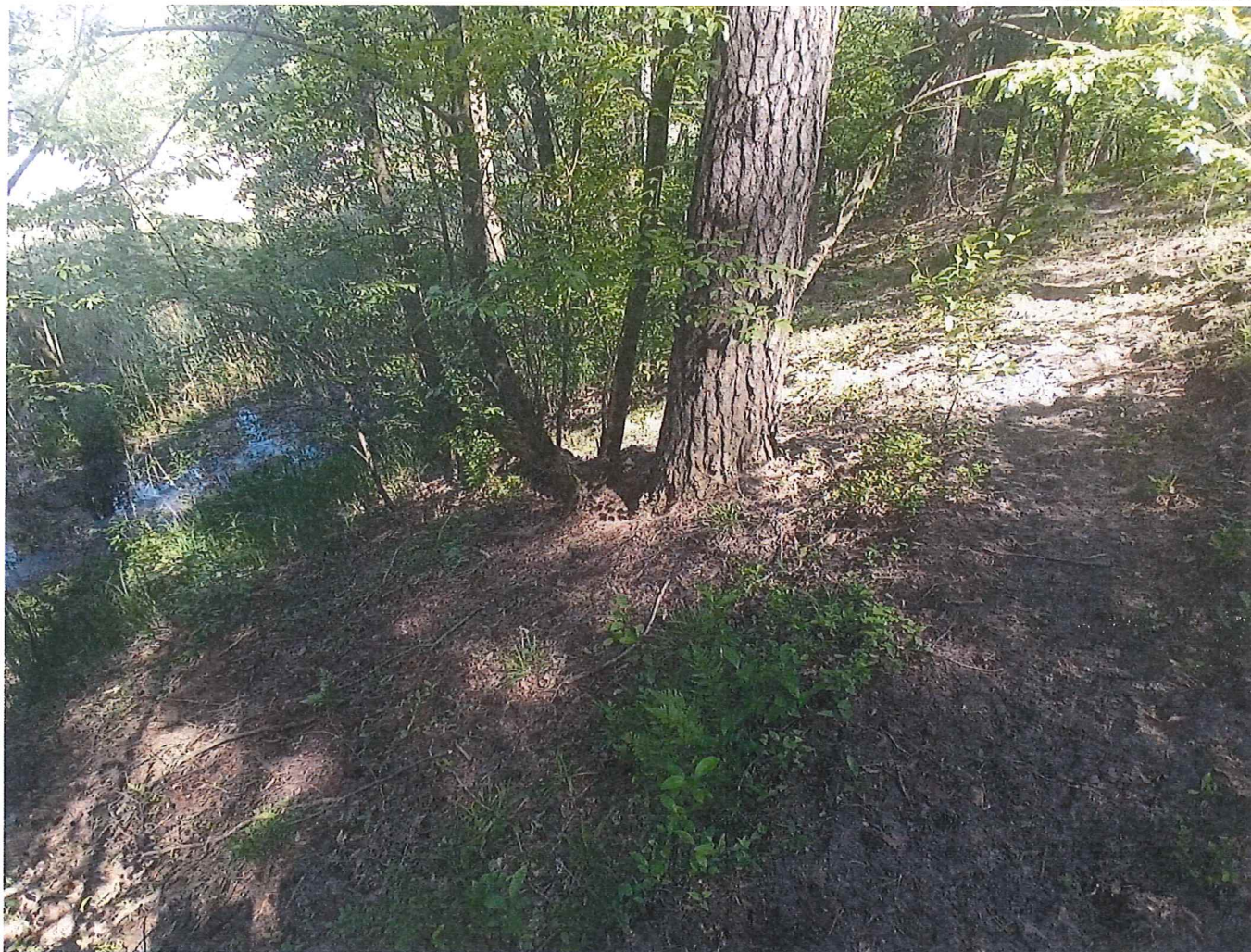
Fot. 2 Widok na część terenu zagrożonego ruchami masowymi ziemi.