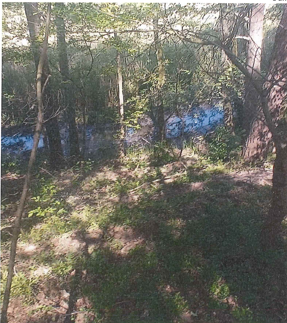
Fot. 3 Widok na część terenu zagrożonego ruchami masowymi ziemi – u podnóża teren podmokły/bagienny.